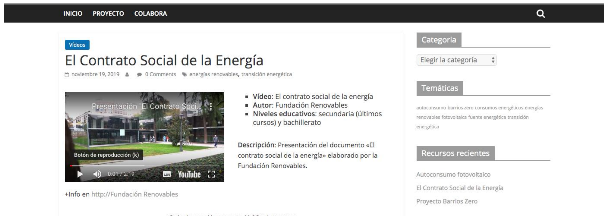
Figura 5. Imagen de la ficha de un recurso tipo vídeo. Elaboración propia.

etiquetado y las etiquetas pueden observarse debajo del nombre del recurso. El recurso se ha clasificado como adecuado para Secundaria y Bachillerato.