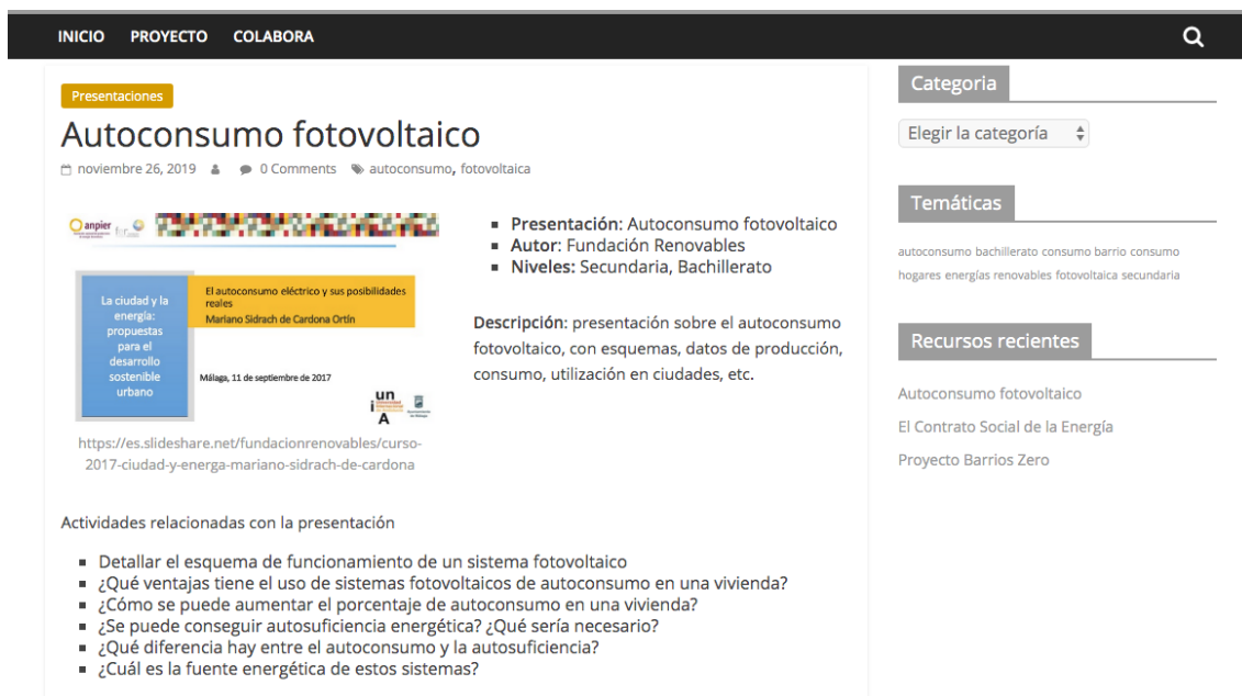
Figura 4. Imagen de la ficha de un recurso tipo presentación. Elaboración propia.

En la Figura 4 se muestra la ficha de un recurso de tipo presentación. En este caso corresponde a una presentación alojada en slideshare . El contenido está etiquetado y las etiquetas pueden observarse debajo del nombre del recurso. En este caso: autoconsumo, fotovoltaica. El recurso se ha clasificado como adecuado para Secundaria y Bachillerato.