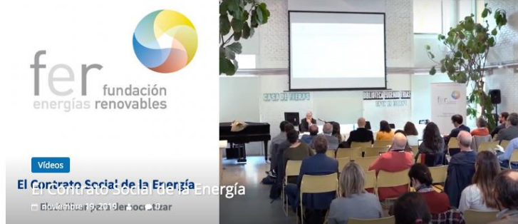
Figura 3. Imagen de la página principal. Elaboración propia.