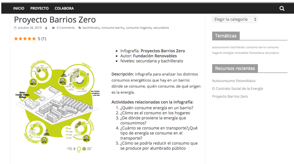
Figura 6. Imagen de la ficha de un recurso tipo infografía. Elaboración propia.